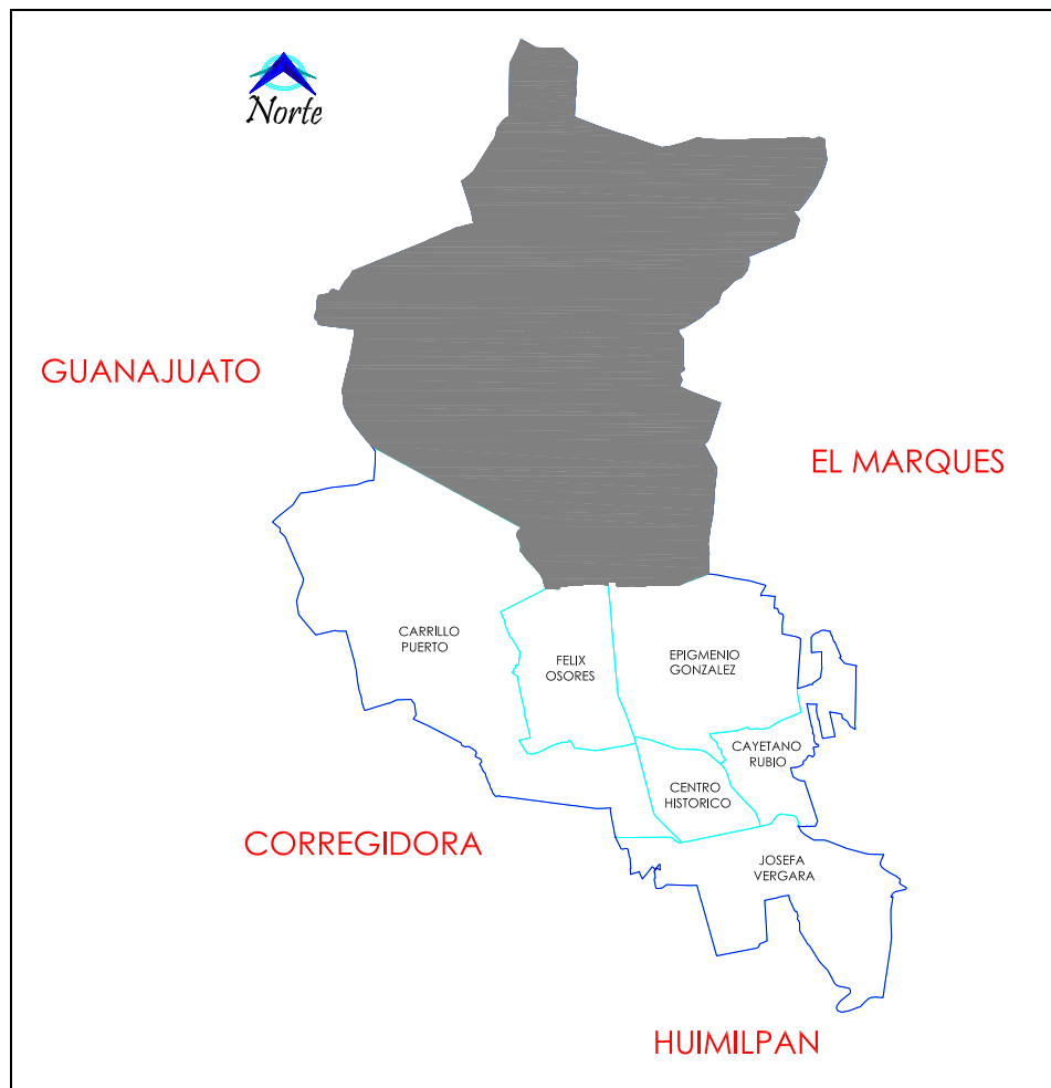
Gráfico 1. Localización de la Delegación Santa Rosa Jáuregui

En el territorio de la Delegación se ubican 49 localidades, de las cuales el 90 % de ellas son de carácter rural, es decir, menores a 2500 habitantes, según el INEGI, y el 10% restantes, dentro lo